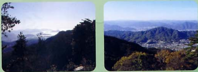
みはらしの丘 (広島湾と市北部のパノラマが展開)