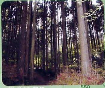
スギ林 (心安らく静内)