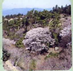
ヤマザクラ (周辺はツバキの群生)