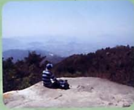
バクチ岩 (広島湾が一望)