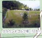
グラウンドゴルフ場(12ホール)