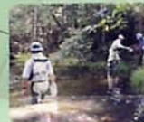
生きもの観察の池 モリアオガエルも生息