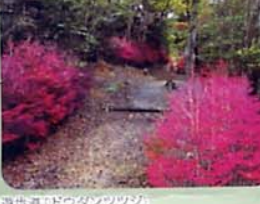
遊歩道「ドウダンツツジ」