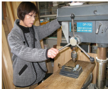
ボール盤でネジ穴を追加