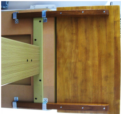
拡幅したテーブルの下面

リーダーやベテラン会員の指導のもと、うまくでき上り、有効に使っています。孫に頼まれて、次は棚ラックをつくる計画です。