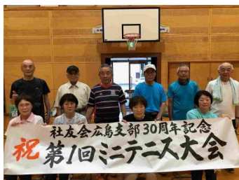
佐東公民館・参加者一同