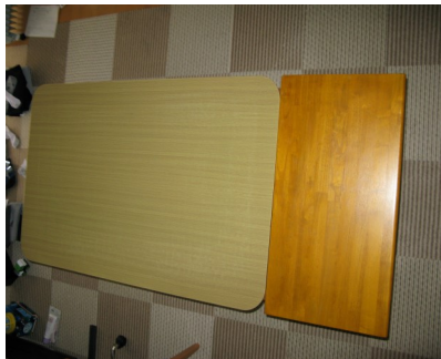
拡幅したテーブルの上面

子供が成長して、使っている食卓テーブルが狭くなったと娘に聞き、テーブル拡幅の案件をもって梅田工房のものづくり同好会を訪ねました。相談したところ、最初考えていた折り畳みの脚を付けた天板追加の案のほかにも、いろいろな構想が出てきました。脚を増やさないで、本テーブルに差し込んだほうが足元の邪魔にならないと指導を受け、サブテーブルの裏に2本の差し込み用角材を付け、本テーブルにそれを受ける金具を付けることにしました。そして、すぐに天板の材料を確保してもらい、基本設計と各種機械の使用方法を教わりました。