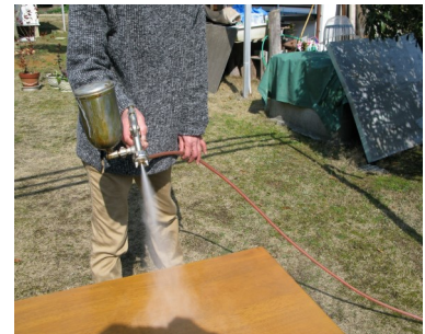
スプレー塗装仕上げ