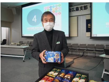
ビンゴゲームでゲット