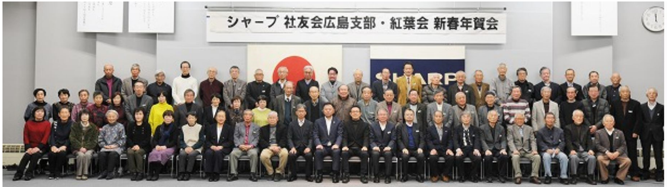
新春懇談会に出席された皆さん

2024年1月19日（金）通信事業本部 多目的ホールにて68名出席のもと2024年新春懇談会を開催しました。第一部 支部長挨拶、来賓挨拶、第二部 「終活セミナー」と題して講演をいただきました。最後にビンゴ大会を開催し大いに盛り上がりました。