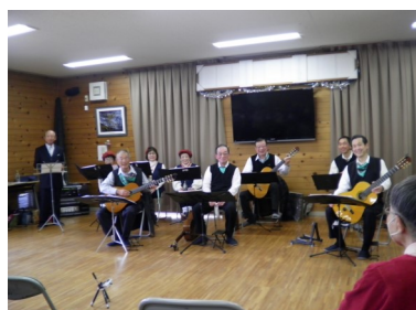
アンダンテ今回は9人参加