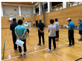
開 会 式