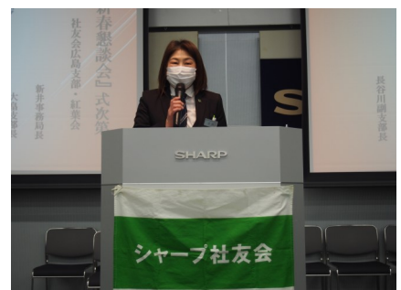
終活セミナーの講演