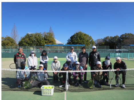
テニス同好会集合写真

皆さん、こんにちは。テニス同好会の活動状況をご連絡させていただきます。現在テニス同好会の活動は、毎週水曜日午前9時から12時までを基本として（夏季・冬季は午前10時から）東広島運動公園テニスコートで開催いたしております。凡そ20名弱の参加者で、メンバー内の体力の維持及びスキルアップを取組として基本練習と練習試合を実施しております。又、初心者にはわかりやすく丁寧に指導を行いテニスが継続できるように取り組みも実施中です。