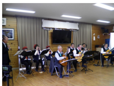
ギター・ウクレレ・ハーモニカに美声

今回は演奏を録画・録音をしてみました。後で確認すると至らぬ部分に気付かされます。まだまだ練習が必要だなあと改めて感じました。次に向けて頑張ろう！