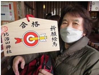
比治山神社祈願絵馬

今回、市内紙屋町付近の市街地での団体行動を心配しましたが、リーダー・各サブリーダーの協力で、事故もなく進めることが出来ました。今後も益々元気で且つ笑顔で楽しく歩きましょう。