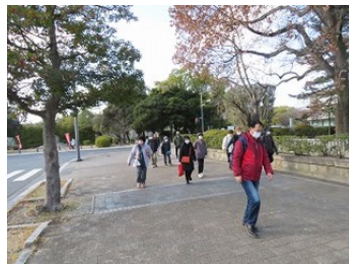
広島城公園ウォーキング