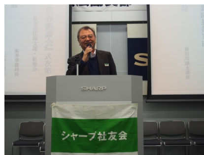
長谷川副支部長 閉会の挨拶