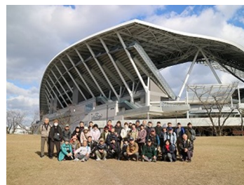
エディオンピースウイング