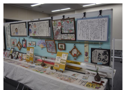
絵手紙同好会作品展示