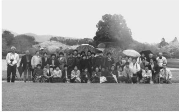
レンズは曇るし、水滴は着くし太陽がないから、ファインダーは暗いし、こんな環境でよく写せたものだ。

倉敷美観地区、ここには観光バス用の駐車場がない。一旦、乗客を降ろして集合時間を伝えて、何処かへ消えてしまう。