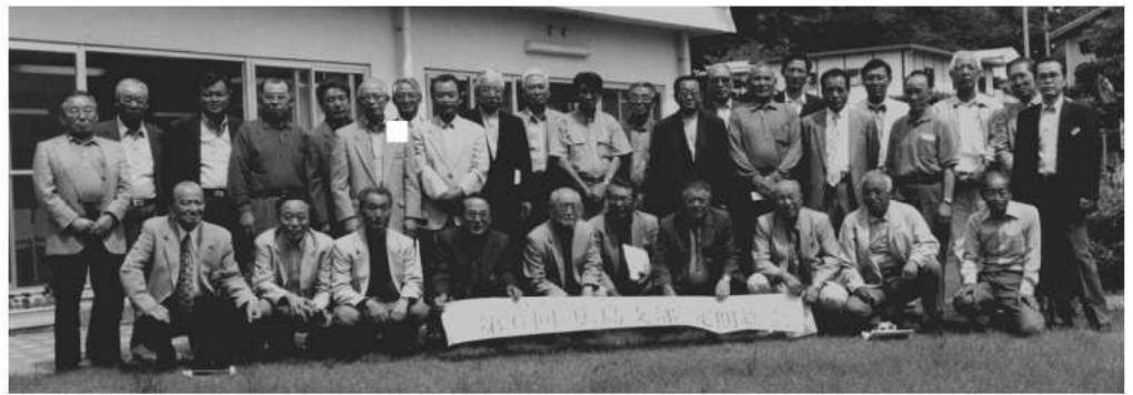
第6回シャープ社友会広島支部総会に出席の皆さん

③ 宿泊は、温泉であること。 の条件のもとに、十一月中旬の月々金の間に1泊2日を計画することになりました。 日程・予算・コース等の詳細と参加へのお願いは、九月中に行う予定です。 (企画担当)