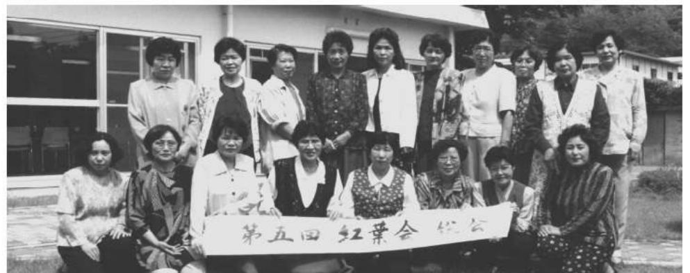
第5回 紅葉会総会に出席の皆さん