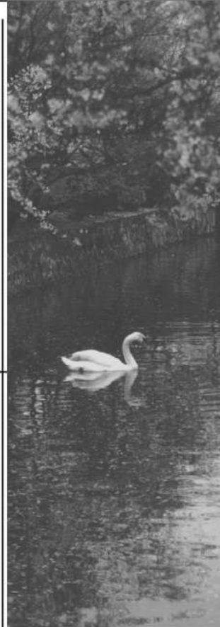
行ったり帰ったり、倉敷川のみずとりは、悠然と慌てず騒がず、あるがままに、とみえました。

何度も訪ねた岡山 倉敷でまたもやおなじみの場所ではありましたが、同行の方々が違い、季節が違い、年齢も違い、また違った印象と感動でした。