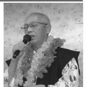
右 カラオケにも人柄が色濃く表れている。「杖立温泉」宿舍の露天風呂で。陶然たる雰囲気です。