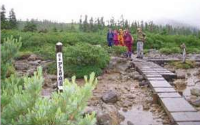
雲の平 アラスカ庭園にて

八月二三日(土) 昨夜から雨が降っている。この分では雨は止みそうにない雲行きだ。雨具を着て5:45薬師沢小屋を出発。小屋の前はすぐに吊り橋。少々揺れ気持ちは悪い。注意して渡り川沿いを少し歩いて直ぐに急な坂を登る。針葉樹林帯のなか長い登り坂、とき折階段を進む。容赦なく雨は降り登山道が川と化し、まるで沢登りをしているような所が点在する。所々休憩を挟みながら歩くとなだらかな木道に変わった。アラスカ庭園8:18着だ。雨に濡れているがそれなり風情がある。このあたり一帯が雲の平だ。なだらかな木道を20分ほど歩くと奥日本庭園に着いた。小雨になったので軽く朝食をとった。少しガスがかかっていたが、天気が良ければ素晴らしい庭園に違いない、と思った。それから15分程で雲の平山荘へ到着9:00。山荘で15分ほど休んで高天原へ出発。相変わらず雨が降り靴の中まで水が入ってくる。奥スイス庭園へ10:10到着。時折ブルーベリーやキイチゴなど山の果物を食みながら、上り下りのなだらかな道をしばらく歩くと高天原峠に到着(11:30)。ここで雲の平とはお別れ、1時間程歩くと宿泊する高天原山荘へ到着12:30。雨でゆったりと雲の平を散策することが出来なかったが、おかげで早めの到着だ。山荘で部屋に案内され、すぐに入浴の支度をして高天原温泉へ、登山靴のまま山荘から15分ほど下りていった所に温泉があった。簡易脱衣所で服を脱ぎ乳白色の温泉へ浸か我々しか居ない。源泉が直接流れ込んで湯加減も丁度よくとても気持ちがいい。前に川が流れ、その向こう側にも