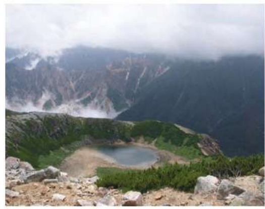
鷲羽岳から硫黄尾根と鷲羽池を望む

4:30起床、5:00に朝食を食べ、5:45に山荘を出発。天気が悪いので雨カッパを着て行動、なだらかな沢のような水溜りの登山道を歩く。1時間余り歩いた所で「ゆっくり歩きたい」という意見が出て3名と4名に分かれて歩くことにした。水晶池に6:50着、ひと休み、なだらかな道を進む。この辺りは高山植物が沢山咲いており、お花畑のようだ。9:20に岩苔乗越へ到着。後続組みと合流。ここでコースを3つに分けた。祖父岳(2825m)登山組2名、黒部川源流組3名、そしてワリモ岳(2888m)と鷲羽岳(2924m)縦走組2名。私はワリモ岳の縦走へ参加。9:50にそれぞれの方向へ出発。岩の登山道を進んでいく。黒部源流のコースを歩いている3人の姿が豆つぶのように見える。ワリモ岳山頂には10:30に到着。雨も止み徐々に天気が回復している。赤チャケタ山肌の硫黄尾根の姿が印象的だ。そして時折りイオウの臭いもする。11:10に鷲羽岳へ登頂。今日は少しガスがかかって隠れている山も多い。11:40に鷲羽岳を出発、ほとん