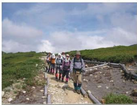
太郎兵衛平へ向かう一行

八月二二日(金) 5時前に起床、昨日の豪雨は嘘のようだ。今日はとても天気がよい。ホテルのバスは6時に出発。雨上がりで緑に映えた有峰林道をバスは行く。有峰湖の湖畔をかすめ折立の登山口へ6:30に到着。トイレを済まし皆で準備体操をして6:50に登山開始。直ぐ急な登りとなり、針葉樹木をジグザグに進む。三角点(1871m)のベンチへ8:30到着。とても見晴らしがよく前に薬師岳がそして北側には遠く立山の山々が美しい姿を現している。10分ほど休憩し、なだらかな登山道を歩く。ところどころ高山植物が美しく咲いていて、後方へ有峰湖の全容が見える。しばらく歩くと五光岩ベンチ(2180m)へ到着