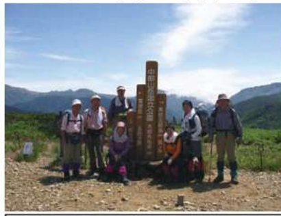
太郎兵衛平にて後方は水晶岳方面

10:16、数分休憩。太郎兵衛平まで2kmだ！よく整備された登山道を暫く歩くと太郎兵衛平(2330m)へ到着11:20。ホテルで作ってもらったおむすびを頬張る、暫く立山連峰、薬師岳、水晶岳などの美しい山々の稜線を眺めた。天候に恵まれとても素晴らしい眺めだ。12時に太郎兵衛平を出発。今晩宿泊する薬師沢小屋(2122m)まで下る、よく整備された木道を歩く。まだ残雪が残る山々を見ながら歩き、左俣の沢13:15着でひと休み、沢の水でコーヒーを入れる。とても冷たくておいしかった。10分ほど休んでまた木道を歩く。14:55に黒部川の側にある薬師沢小屋へ到着。早速皆で小屋に併設されたテラスへ座ってビールで乾杯。小屋で飲むビールの味は格別だ。今日は客が多いようだ。どうも2畳に3人寝るようになるようだ。5時に夕食、小屋にしては馳走だ。明日が早いので6時過ぎには復る体制。メンバーの機転で復るところは1畳にひとりの広さを確保できた。おかげで全員ぐっすり復ることができた。