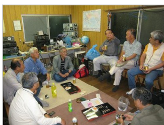
④野呂山無線小屋で交流会