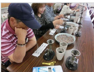
⑤ガラス管の口を塞いだら冷却のため暫くは、静かにして置く。急激に冷やすと、ガラスが割れる事になる。