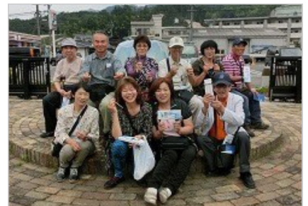
⑧全員が作品を手にしてハイポーズ、お疲れ様でした。