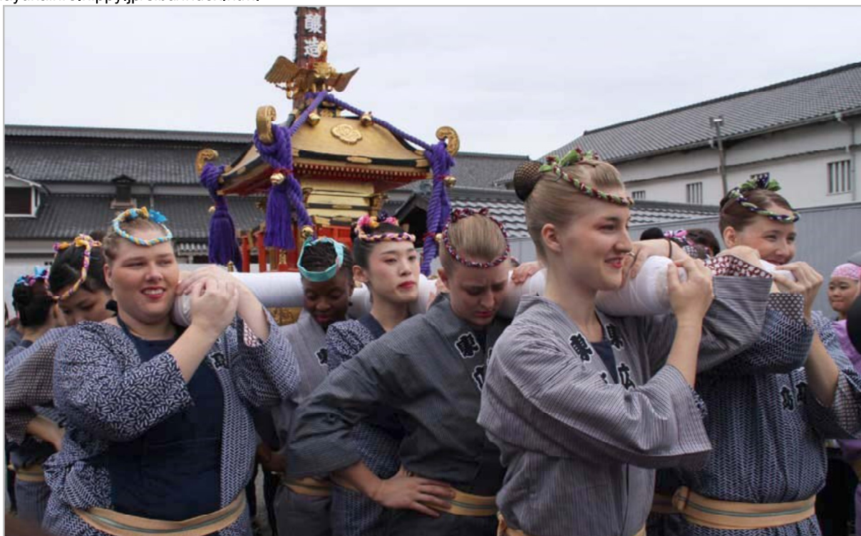
国際化 (東広島市西条)