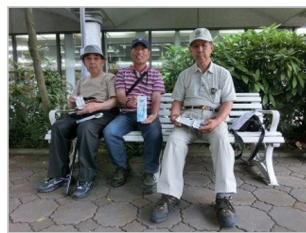
⑥出来上がりの、マドラーを持ってハイポーズ。その他の体験工房は、吹きガラス タンブラーやジッキ・スタンドガラスなども体験できます。何れにしても、創作は楽しいものです。