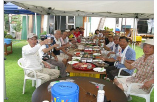
楽しみの親睦昼食会