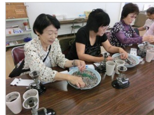
③童心に帰り、必死にガラス工芸の作業をしています。作業とは、1) 極小のピースを、ガラスの管にいれます。2) 入れる量は、指導員の指示に従います。