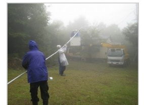
②20mエレメント持上げ