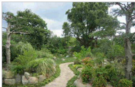
二人三脚で造った自慢の庭、季節によって風情の変化が良い！