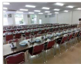
⑦一度に、大勢の人が体験できる様に広いガラス工房団体室。