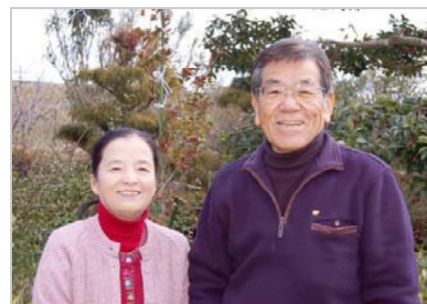
元気にニコリと良いコンビです

と面白くなっていった・・・」と笑顔を見せて話してくれました。また、60歳になってからゴルフを始めたとお二人。一緒に年に20回くらいは行くそうです。米づくりや庭づくり、ゴルフなど・・・。今では何かを二人一緒に行う時間が、気持ちを通わせるきっかけになっています。