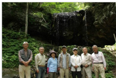
岡山 鏡野町「岩井滝」前で

鏡野町奥津温泉「湯宿 西西」に立ち寄り昨年秋に見た岩井滝のポスターを確認。宿の主人から今冬雪が少なかったのでは水量が少ないとの情報を得た。道の駅で昼食。腹ごしらえをして岩井滝へ。シーズンオフかと思いきや、常連の水汲み屋さんや家族ずれカップルが入れ替わり立ち代り滝に上ってきた。滝の水は少なく縄暖簾よりも透けた状態で寂しい限りであったが、これも自然現象、滅多に見られない少水の岩井滝をカメラに収めた。帰り道、三咲町大坪和西の棚田の夕景撮影を目的に立ち寄ったが、天候悪化により、夕日が望めず断念した。秋の実りの時期にまた訪れたい。