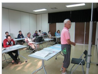
登山基本知識研修会

15:00より企画委員2名により登山基礎知識の講義を受けた、講義内容は服装、行動食、疲れない登山、地図の見方など多岐に渡り2時間にもおよぶ研修となる。