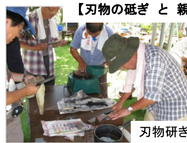
刃物砥ぎ講習風景