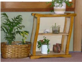
曲面デザインの飾り棚