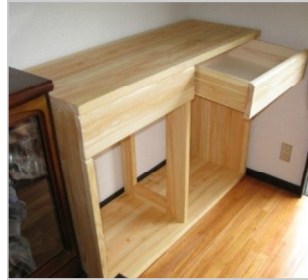
どっしりした 桧木のラック