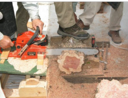
乾燥中のカイズカ輪切りの時計用部材