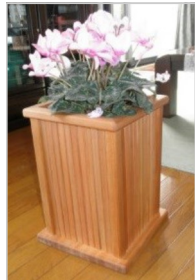
格子デザインの花入れ