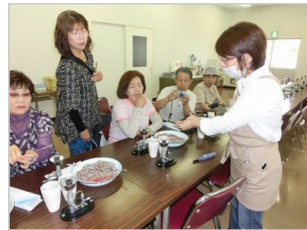
②創作工房で、指導員から説明と諸注意を受ける。ガスの火に注意、特に火傷。