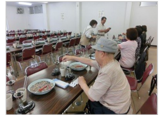
④火傷に注意しながら、管に入れた、ピースが出ないようにガラスの口をガスの熱で塞ぐ。