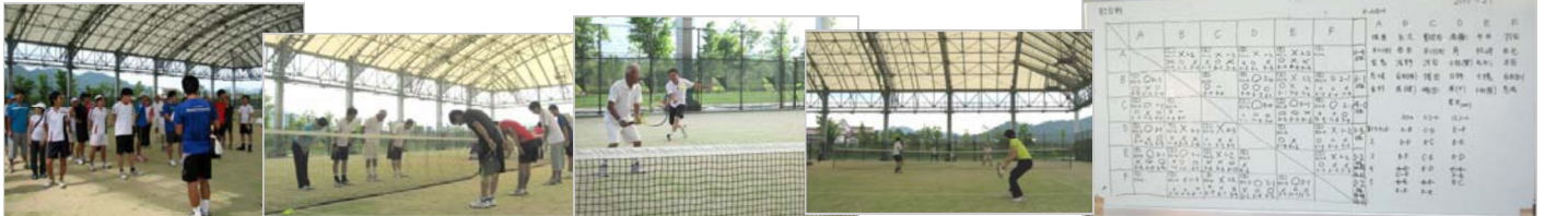
ルール説明から挨拶に始まり、熱戦の連続で程よく疲れて充実の1日、結果はご覧の通り(読めないかな?)