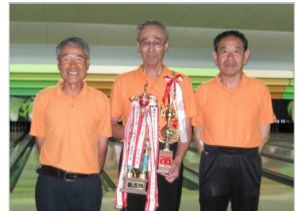
第三位 優勝 準優勝