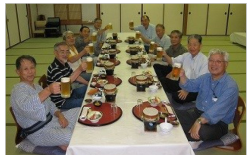
⑥野呂高原ロッジ交流宴会