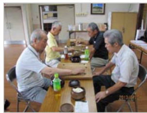
熱戦の様子、真剣です！