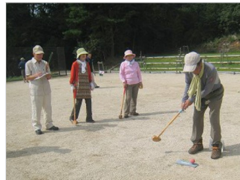
グラウンドゴルフ体験