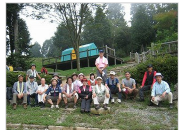
野呂山キャンプ場