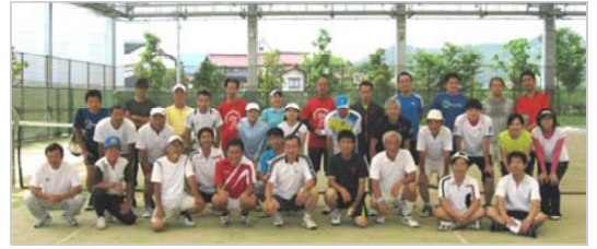
現役・OB・男女混合で多彩な参加選手たち

で素晴らしいテクニックのあるプレーに交じって、一生懸命に自己のできる事を精一杯プレー出来た満足感と親睦を深められた充実感で程よい疲れの一日に感謝。紅白戦は毎年開催されているとのことなので、会員全員が日々の練習を通じそれぞれのレベルアップ、課題の克服をし、今回参戦出来なかったメンバーも、次回は参加し経験できればいい刺激になって新しい境地に入れるかもしれないです!!。現役の方には迷惑かもしれませんが、来年度はメンバー全員が紅白戦参戦を目標に頑張りたいと思います。