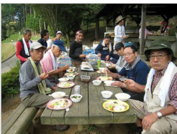
キャンプ場で朝食