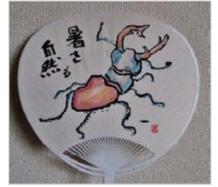
丸山 紀夫 クワガタ虫

シャープのOB会は実業界でもユニークな活動をしていると聞いた。その一端を東広島でもPR出来ればと考えている。