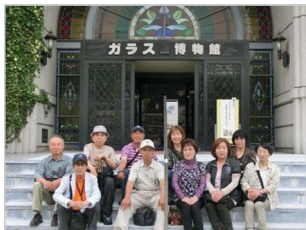
①ガラスの里 博物館の前で、記念写真

平成あそび隊は、支部結成20周年記念行事として、6月9日(日曜日)に広島市安佐北区の【ガラスの里】でガラス工芸の体験と施設の見学を実施しました。ガラス工芸の体験として一番初歩的な作業で、創作工房でガラスマドラーの制作に挑戦です。