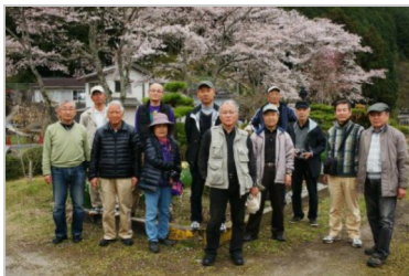
錦川清流線「北河内駅」にて

4月定例撮影会は久しぶりに全員参加で「鉄道のある風景」の撮影を楽しめる撮影会となりました。心配した桜も私たちの撮影会までぎりぎり踏ん張って頑張ってくれたようです。そんな桜花を健気に思い、また私たちの前を何度か行き来してくれた錦川清流線の緑と赤の気動車達への親しみも増したように思った一日でした。