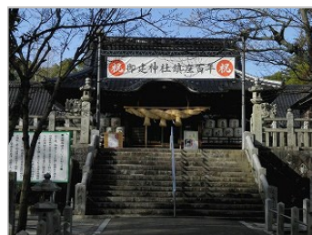
御建神社 西条町西条