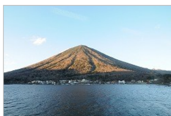
中禅寺湖より望む男体山