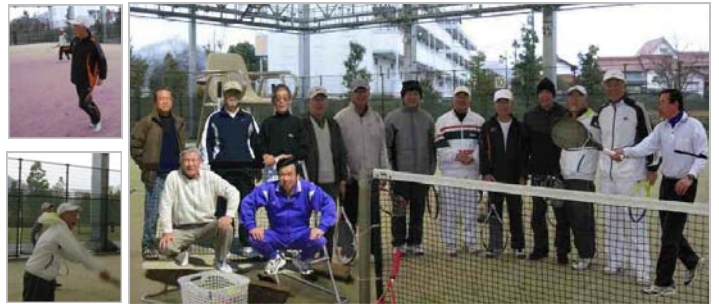
当面の目標はミックスダブルス実現だ！

ルからスタートし、実技面では、思わぬ捻挫、転倒等に注意を払い、今ではこの寒い中で快い汗が滲む程、ボールを追い掛け回す体力も付き、加えて練習試合での珍プレー、ナイスプレーで楽しみも覚えました。更には隣のコートで練習中の同年輩お姉さんからミックスダブルスのお誘いを受け、一日も早い実現に向けて会員一同は精進中です。皆さん、是非一度コートに足を運び一緒に汗を流しませんか？