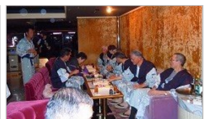
二次会もカラオケで大賑わい