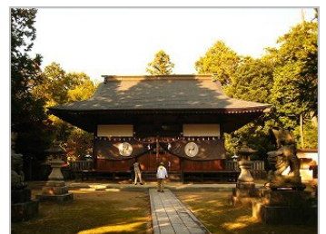
小倉神社 八本松町原