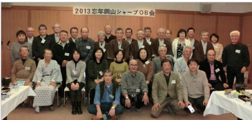
元気に参加のシャープ岡山OBの皆さん