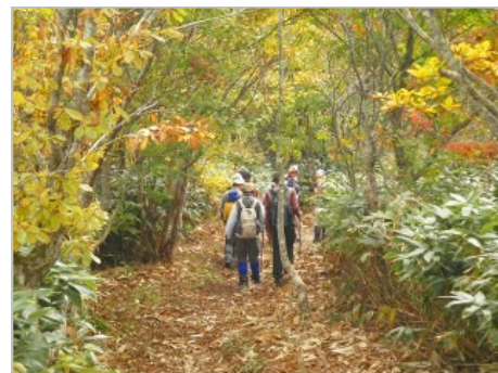
色づき始めた登山道