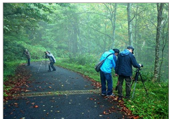
臥竜山（北広島）での撮影会