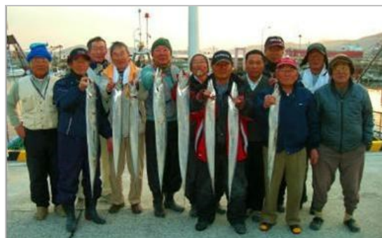
数は少ないが、ドラゴン級も釣れた

昨年は月1回大漁目指して頑張りましたが、今年も頑張っていきます。釣りは楽しいですよ。