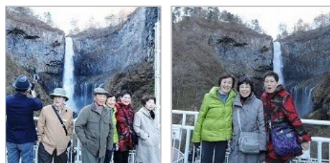
華厳の滝を背に、チョット寒そうですね