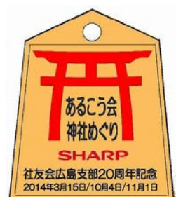
20神社名を記した通行手形