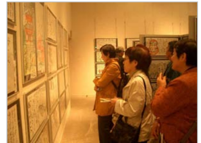
筆の里工房ロビーで、展示場では熱心に作品を鑑賞する会員の皆さん