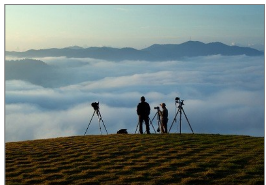
荒谷山（安佐北区）での雲海撮影

太田の大銀杏、宮島の紅葉、三原の海霧等の定例撮影会や有志撮影会を行い、冬には雪景色の撮影を計画するなど、着々と準備を進めております。ご期待ください。