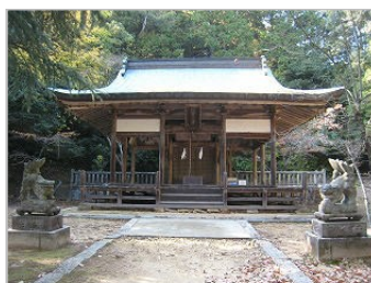
雷八幡神社 八本松町原