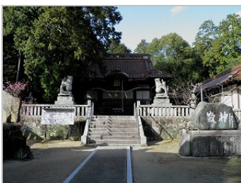
諏訪神社 西条東北町