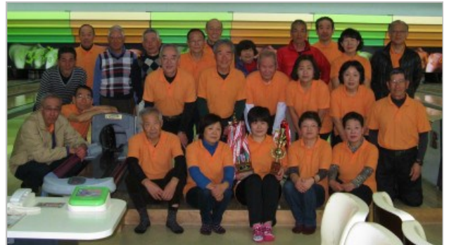
初では？女性1～3位独占！！