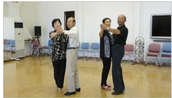
10周年記念大会に向け楽しく練習中

ワルツを取り入れて練習をしています。新しい二人も、中に入られて出来るステップから先生の指導のもと頑張っています。今は、男性が少ないので遊びのつもりで見学に来てください。お待ちしております。初めての方も大歓迎です。