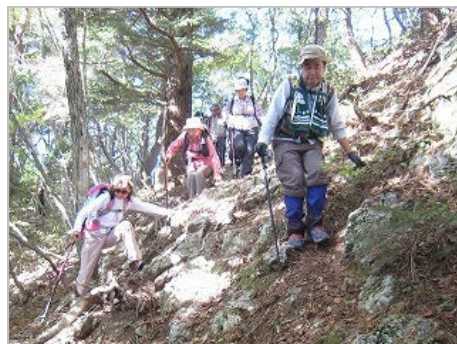
滑りやすい岩場を慎重に登る