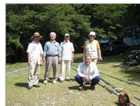
左から ①エレメント組み立て ②支柱にアンテナ取付 ③完成した7MHzフルサイズアンテナ ④作業に参加のメンバー