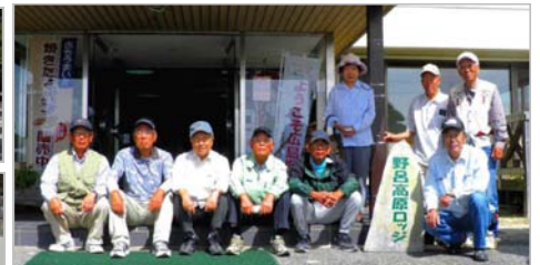
競技の様子とロッジの前で記念に！