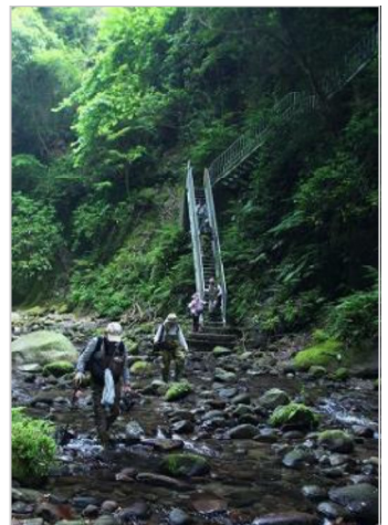
急勾配を降り溪谷に入る