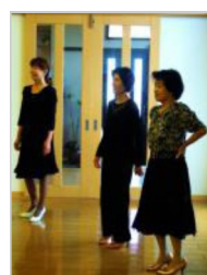
先生の模範演技を見て

しかし先生は私達以上に汗をかき、また服装も長袖のカッターシャツのため額に大粒の水たまりができ気の毒に感じます。習う私達もまた休むことなく頑張っています。練習時間が終わるとほっとします。今ワルツ、チャチャに力を入れて練習をしています。ワルツはスエーのポーズが難かしく何度も繰り返し指摘を受けています。肩のライン、目線、体重のかけ方が特に重要視され、何度も模範演技をされます。メンバーは何度も相手を変えて練習し成果の向上を目ざしています。チャチャは習い始めて日が浅く、基本のステップを繰り返し、早い音楽に体が反応しリズムとステップが合うように励んでいます。