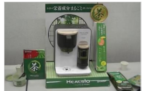
SEMCによる『ヘルシオお茶プレス』の紹介と試飲会が実施