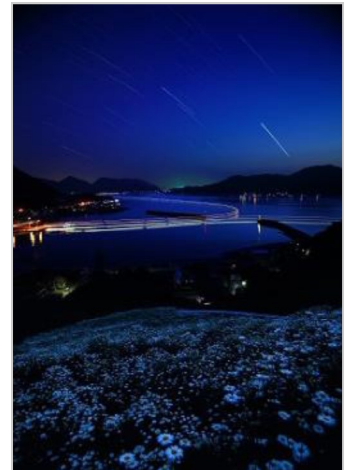
因島重井港の除虫菊

6月の撮影会は「九州一泊撮影会（東洋のチロル由布川峡谷 & 有明海のムツゴロウ）」を開催。梅雨真っ只中、天候と睨めっこしながら6月14～15日に九州一泊撮影会（大分～熊本～佐賀）を開催し会員8人が参加しました。初日は早朝5時に東広島を出発し大分県の由布岳と鶴見岳の間を流れる由布川の景勝地「由布川峡谷」に昼前に到着。峡谷に繋がる猿渡入り口は勾配45度以上もある目が眩むような長い鉄製階段を降りなければなりません。峡谷は河床が深い場所が随所にある事から胸まであるウェダーチェスト（鮎釣り用ゴム長）を身に付けて重い三脚とリュックを背負って慎重に河床を歩きます。深さ50m以上ものV字型の峡谷が約12Kmにわたって続き、様々な場所から幾筋にも糸のように流れ落ちている滝や滑らかで迫力ある岩肌はまさに自然の造形が誇る芸術作品のようです。神秘的な峡谷美に感動しながら無言の中でカメラのシャッター音だけが忙しく谷に響きます。今回は20筋近くも流れる素晴らしい「すだれの滝」を全員で見る事が出来たのは非常にラッキーでした。