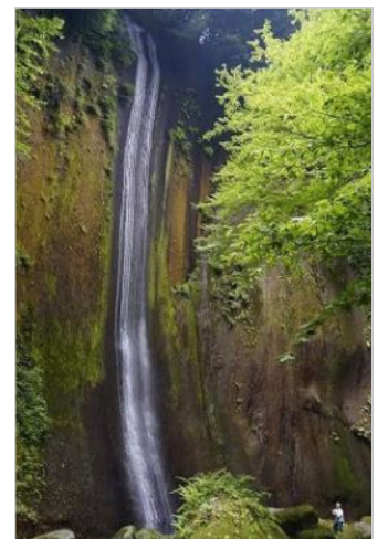
溪谷一優雅なすだれの滝