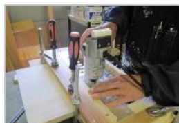
5. プレートに沿って