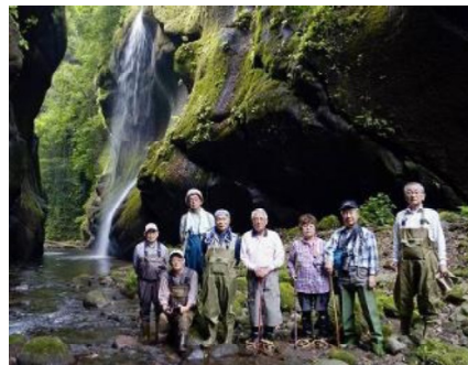
猿渡り滝前での記念写真

6月の撮影会は「九州一泊撮影会（東洋のチロル由布川峡谷 & 有明海のムツゴロウ）」を開催。梅雨真っ只中、天候と睨めっこしながら6月14～15日に九州一泊撮影会（大分～熊本～佐賀）を開催し会員8人が参加しました。初日は早朝5時に東広島を出発し大分県の由布岳と鶴見岳の間を流れる由布川の景勝地「由布川峡谷」に昼前に到着。峡谷に繋がる猿渡入り口は勾配45度以上もある目が眩むような長い鉄製階段を降りなければなりません。峡谷は河床が深い場所が随所にある事から胸まであるウェダーチェスト（鮎釣り用ゴム長）を身に付けて重い三脚とリュックを背負って慎重に河床を歩きます。深さ50m以上ものV字型の峡谷が約12Kmにわたって続き、様々な場所から幾筋にも糸のように流れ落ちている滝や滑らかで迫力ある岩肌はまさに自然の造形が誇る芸術作品のようです。神秘的な峡谷美に感動しながら無言の中でカメラのシャッター音だけが忙しく谷に響きます。今回は20筋近くも流れる素晴らしい「すだれの滝」を全員で見る事が出来たのは非常にラッキーでした。