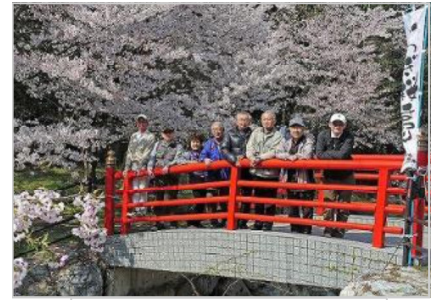
岩城島桜公園での記念写真