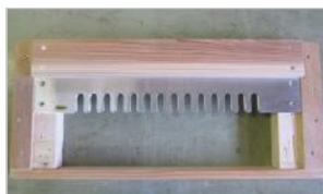
1. テンプレート治具