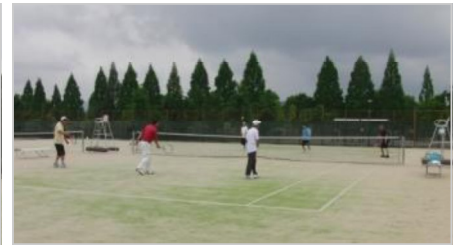
各自、最良のリターンと、最高のフォームを目指してレベルアップ。

ものづくり同好会に入会して、3年になりますが、その間いろんな加工技術を習得させて頂きました。今回、紹介いたします加工技術は、高級家具等に広く採用されている“包アリ組加工”という組手技法です。板と板の接合組手の一つで、先端が広がる様に台形に加工して組み込む技法で、先端が広がっている分、箱の角の接合力が強く、又 前から加工溝が見えない為、仕上がりが綺麗な組手です。