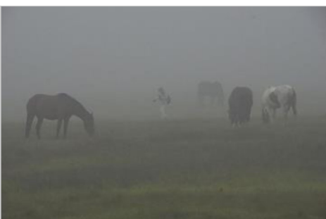
阿蘇 草千里の早朝 草を食む野生馬

早朝の濃霧の中で放牧馬が草原に憩う光景を撮影した後、帰路、有明海「小城市のムツゴロウ王国芦刈」に立ち寄り、今、正にムツゴロウの恋の季節で愛らしく活発に動き回るムツゴロウのジャンプ&カニのツーショットやムツゴロウ同士の縄張りを巡る威嚇光景を高速シャッターで連写撮影。