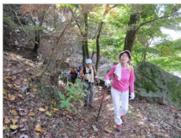
武田・火山登山道入口スタート

平成27年11月16日広島市内を一望できる、火山、丸山の縦走を実施した。晴天の下、総勢16名（男11名女5名）ダイキ祇園店に広島地区の会員と合流、公園に向け出発した。火山公園ではルート説明と準備運動後、9時40分に例会登山に出発した。鹿ヶ谷で休憩、水越峠を通過、火山に11時30分到着。楽しい昼食、雑談やダンスを楽しみ、12時20分に丸山に向かう。権現峠や観音山を経由して丸山に14時到着する。