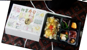
隠岐めし認定弁当

到着後、境港のおさかなセンターで最後の買い物をし、一路東広島に向け帰路につきました。帰路は途中から、375号を利用し予定より多少早く、6時過ぎ全員無事、ラポール賀茂駐車場に到着。