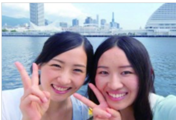
従来のインカメラで撮影