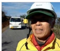
カモンケーブル テレビ インタビュー