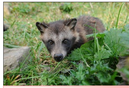
タヌキ2,000匹以上生息

次に、国の名勝と天然に指定されている赤壁に向かいました。タヌキ、馬、牛、多くの動物、特にタヌキの可愛かった事、と、赤茶色の断崖絶壁に感激。また、牛は道をのんびり歩くために逆にバスが遠慮して通りすぎるほどでした。その後、漁協でサザエ27キロ！！の爆買をして知夫里島を後にしました。今度は、大型フェリーです。ホテル知夫の里の厚意で別れのテーブルを準備して頂き、名残をおしみながら出港。