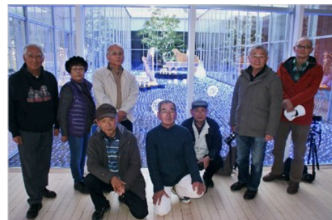
幻想的なイルミを背景に

12月8日、社友会室での定例会終了後、三原市芸術文化センターの喫茶室に場所を移し、少し早いクリスマスパーティー。一年間を振り返り、早くも新春の撮影計画に話が弾みました。午後5時にイルミネーションが点灯すると一斉に撮影開始。煌々イルミネーションの中でシャボン玉が漂う幻想的な風景の撮影を楽しみました。