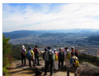
火山～丸山岩場で絶景を堪能