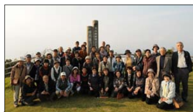
摩天崖で記念撮影