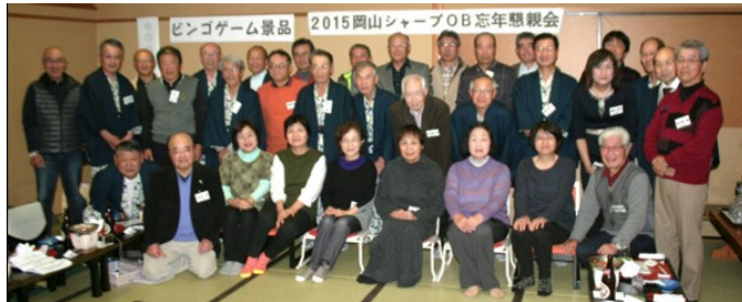
2015 忘年岡山シャープOB懇親会

当日は天候も心配されましたが、天のご褒美で、晴れ間も覗き、バスツアーじゃないけれど、大よそ参加者半数の方が送迎バスに乗り、再会に話が弾み車窓より遅れていた紅葉を楽しみながら2時間弱でホテル到着。他のメンバーも自家用車等にて合流。