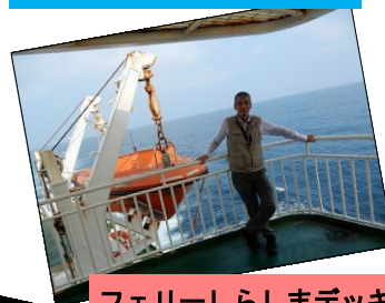
フェリーしらしまデッキにて

到着後、境港のおさかなセンターで最後の買い物をし、一路東広島に向け帰路につきました。帰路は途中から、375号を利用し予定より多少早く、6時過ぎ全員無事、ラポール賀茂駐車場に到着。