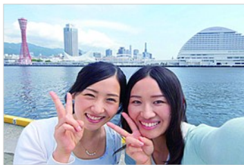
★広角インカメラで撮影★

今までより、背景がしっかり入った 素敵な写真が撮影できます！ セルフタイマーも搭載しているので ポーズを決めてパシャッ！