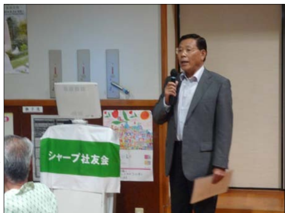
知夫村副村長ご挨拶