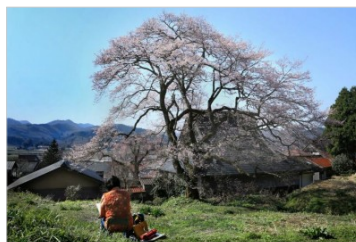
廣兼さん「やっと咲いたネ」