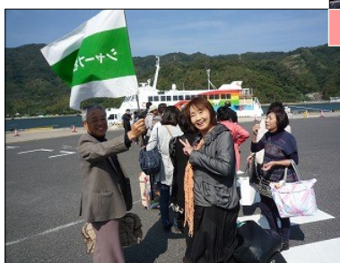
レインボージェット乗船中