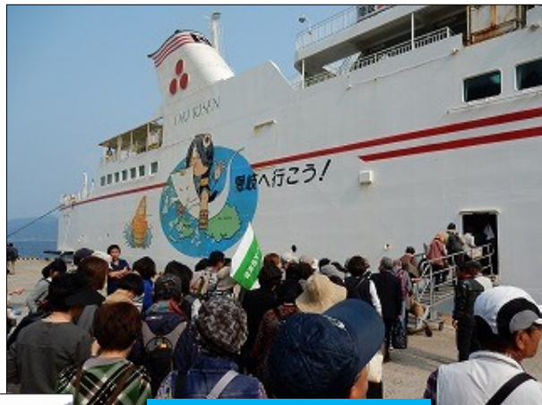
フェリーしらしま乗船

船内では、ホテル知夫の里の“隠岐めし認定弁当”を食べながら、眠りにつく人、のんびり旅行の話をする人等、人それぞれ過ごしながらかつ港まで2時間25分の船旅でした。