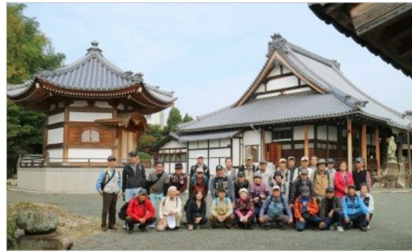
慶徳寺にて（左側の六角堂は総檜づくりで住職の自慢、中には経典がぎっしり）