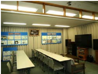
リニューアル後の社友会室

I：冒頭、東支部長より会員の皆さんが、気軽に談笑できる場として、また、楽器演奏やレコード鑑賞等を通して旧交を深めるのに相応しいサロンの場にしようとの提案から、およそ1年、皆様のご協力によりリニューアル出来たとのことです。