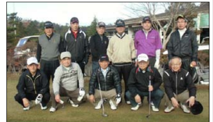
ゴルフコンペ参加の皆さん