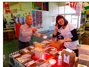
境港さかなセンターで買いもの

次回、春の親睦日帰り旅行は、平成28年4月7日（木）に日本のエーゲ海といわれる岡山県牛窓です。多数の皆さんと会えることを楽しみにしています。