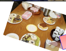
紅葉会より軽食提供