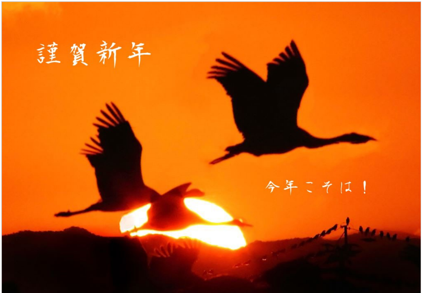
「光輝」