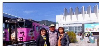
ねこむすめ列車前で記念撮影