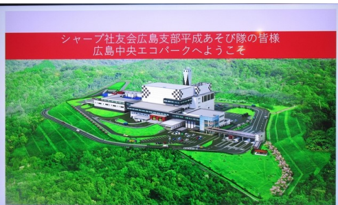
シャープ社友会広島支部平成あそび隊の皆様 広島中央エコパークへようこそ

広島中央エコパークは、廃止された賀茂クリーンセンターに隣接して、昨年10月1日にオープンした。広島県でも最大級/最新鋭のクリーンセンターで、最先端の破碎技術で、従来の埋立てゴミのほとんどが可燃ゴミと混ぜて、超高温焼却(1800℃)でき、その熱で熔融スラグ/メタルが再資源化されるとともに、高熱を利用して高効率発電をしている。エコパークで使用する電力のほぼ全量を自前でまかない、余剰電力は売電に回している。最先端を駆使して、SDGs象徴のクリーンセンターです。