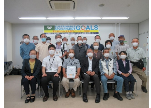
出前講座研修会参加者