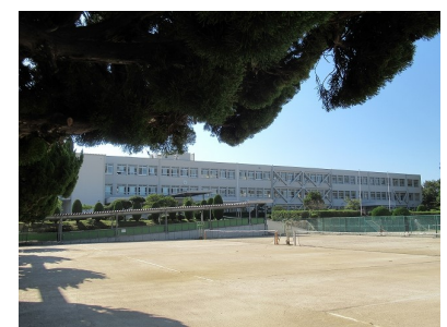
東広島市立八本松中学校