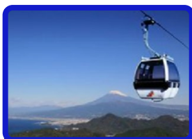
伊豆の国パノラマパーク