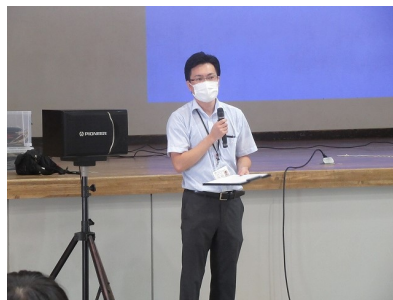
社会福祉協議会スタッフ挨拶