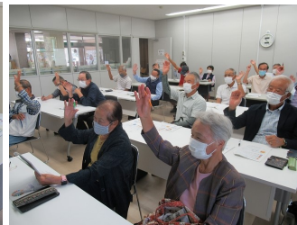
クイズに挙手で回答