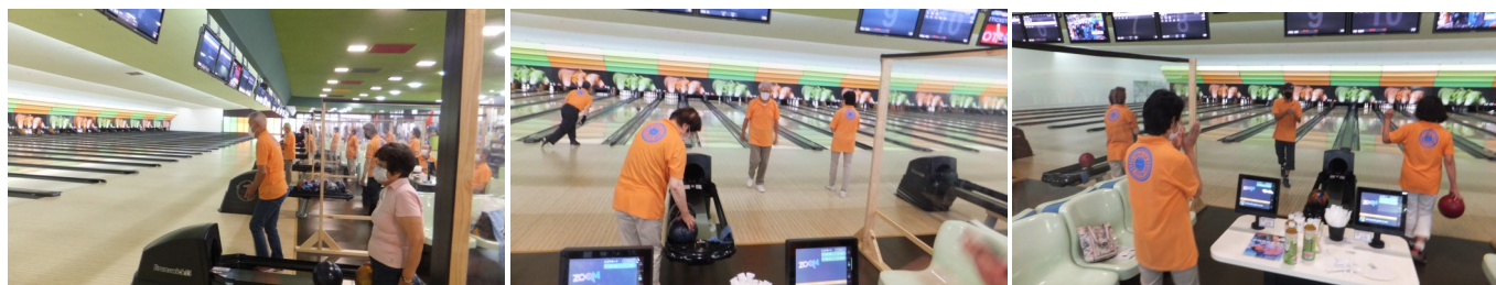
～ 第91回大会風景 ～