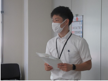
市・政策推進監よりSDGsの説明

この出前講座を聴講し、各同好会ごとの目標設定も決めて、パートナーとしての支部目標を具体的に提言してゆくこととなった。