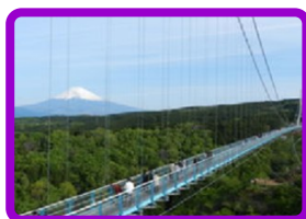
三島スカイウォーク