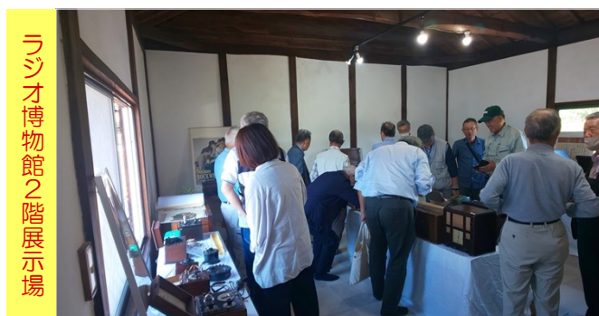
ラジオ博物館2階展示場

ラジオ博物館の見学風景。仮オープンなのでまだ展示されている機器数は全体の1/3程度であるが、1900年代初頭のアンティークやビンテージ品を数十点展示しており、皆さん興味を持って観覧されていた。