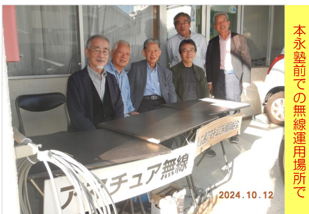
本永塾前での無線運用場所