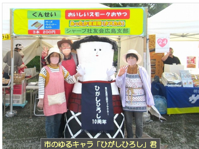
市のゆるキャラ「ひがしひろし」君