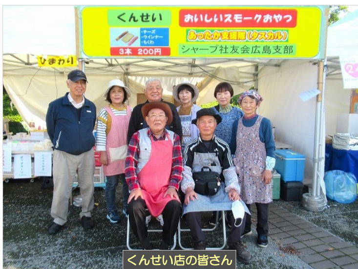
くんせい店の皆さん

今年は市政50周年記念開催で、観客がゆっくり過ごせるイートインスペースが設置された。前々日と前日が警報級の大雨でたいへん心配したが、当日は秋晴れでラッキーでした。あるこう会も日程を合わせて多数来店され、にぎやかなひとときだった。