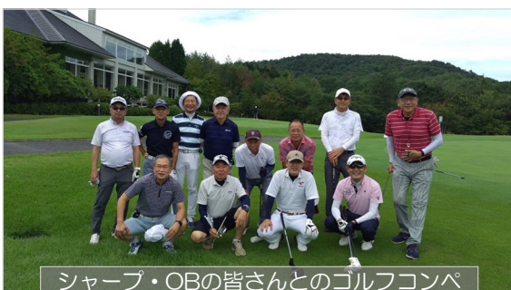
シャープ・OBの皆さんとのゴルフコンペ

社友会や地区役員などの活動もさせていただき、また体力維持の下手なゴルフなどを通じ、新たな仲間を広げつつワイワイ楽しんでいます。振り返れば、社会環境や世界情勢や AI などありとあらゆるものが大きく変わりました。