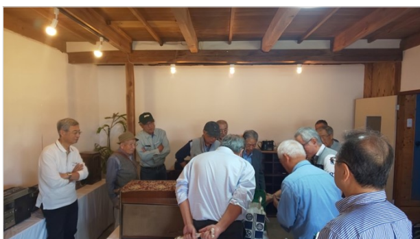
ラジオ博物館1階展示場