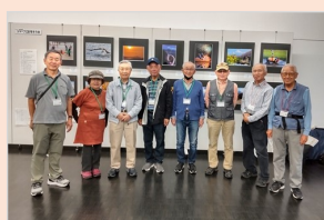
東広島市立美術館にて