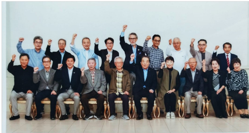
第1回 新 愛媛 シャープ OB会 令和6年10月26日 於 ANAクラウンプラザホテル松山

次回も健康で更に多くの参加者による開催が出来ることを約し、解散することが出来ました。