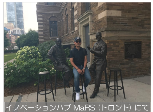
イノベーションハブ MaRS (トロント) にて

現役時代に厳しくご指導いただいた諸先輩や仲間との時間は何物にも代えがたく、その中でリアルに学ばせてもらったスキルやマーケティング、ネットワークは今でも、基本は現役といえます。（不滅とは言えませんが）