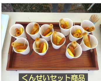
くんせいセット商品