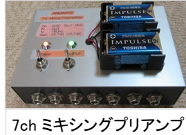
7ch ミキシングプリアンプ

川上地域センターに掲示してある、楽器演奏の会『アンダンテ』のポスターを見て、桜が丘保養園の相談員の方から園遊会での演奏の依頼を頂きました。会場の下見に行くと、ステージのある広い食堂での演奏です。9月に訪問した吉川の敬老会会場と同じでhibiki 110号でも記載した、後ろの方まで演奏が聞こえるかが問題でした。そこで前から考えていた、各ギターにピエゾマイクを付け、ミキシングアンプを通しての演奏と成りました。会場のPA装置を利用するため、その自作アンプを持って再度会場を訪れ調整を行いました。