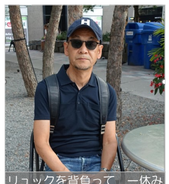
リュックを背負って 一休み

古希は一つの節目。今から人生のスタートという気持ちで、これからも現役であり続けたいものです。