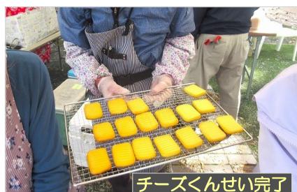
チーズくんせい完了