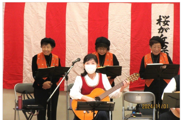
ハーモニカの皆さん