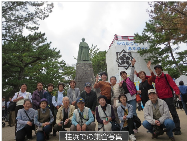
桂浜での集合写真

1日目： 八本松の社友会駐車場に集合し8:20に出発山陽自動車道を通り、早島ICから瀬戸内自動車道に入り四国を南下する形で桂浜まで行き、そこで食事をしました。