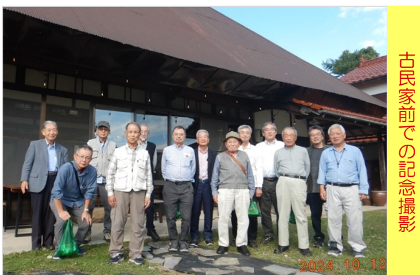
古民家前での記念撮影