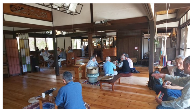
古民家カフェでの昼食風景

博物館の見学後に古民家カフェの昼食を食べながら交流を行った後で、西条酒まつり会場へ移動。散策後にJA4YRL公開運用の本永塾から標高500mの東広島天文台そばのJA4RLポータブル4の公開運用場所へ移動した。