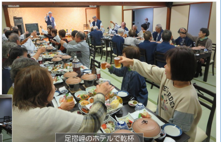
足摺岬のホテルで乾杯