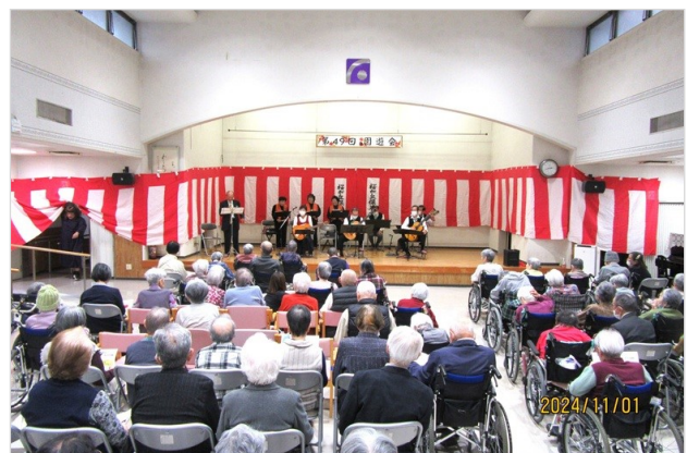
会場では大勢の方が楽しんで頂けた