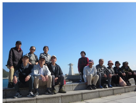
平成の高どうろうにて