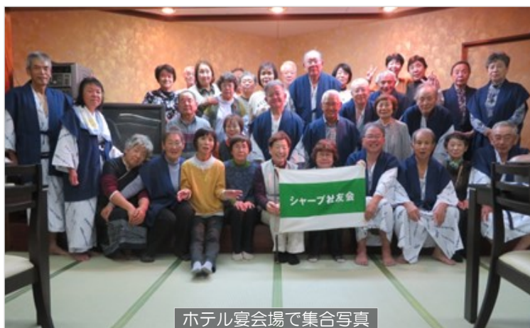
ホテル宴会場で集合写真