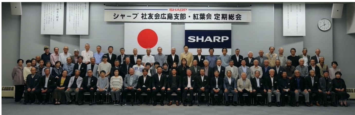
定期総会に出席された皆さん

2025年5月23日に社友会広島支部・紅葉会の第32回定期総会行われ、76名（社友会・紅葉会）の方が参加されました。第一部は支部長挨拶、2024年度の事業・行事、一般会計決算/会計監査等の報告と2025年度の事業・行事予定や一般会計予算等が審議され承認されました。第二部は来賓挨拶、特別講演、フォトコンテスト授賞式、大抽選会など開催され大いに盛り上がりしました。 場所：シャープ通信事業本部 センタービル2階 多目的ホール