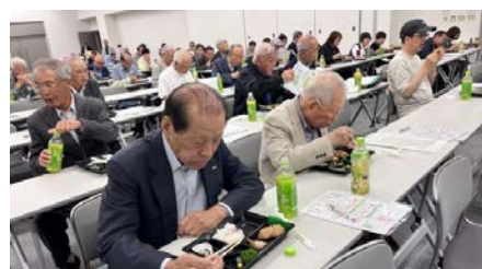
会場の風景（ランチタイム）