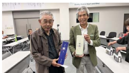
大抽選会でゲット