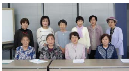
紅葉会総会に出席された皆さん